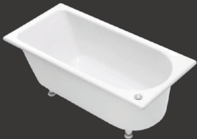
鑄物ホーロー浴槽 CASTIE