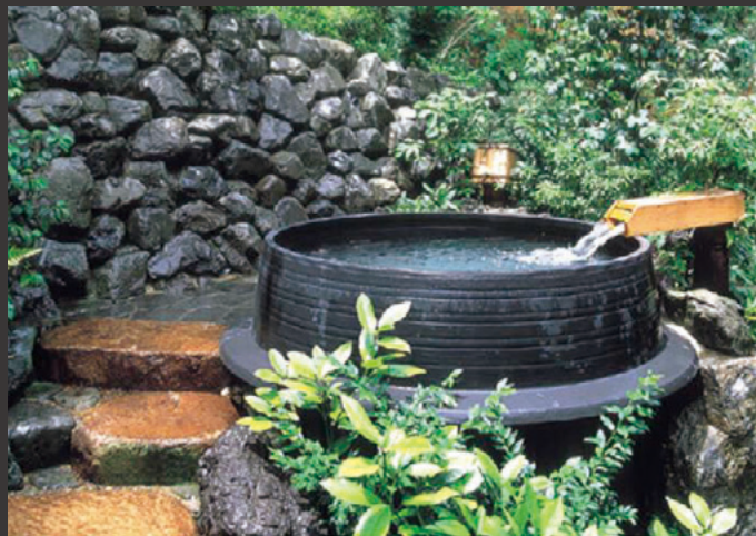
羽釜風呂 (135) 特注