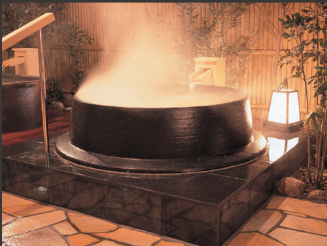
羽釜風呂 (120) 特注