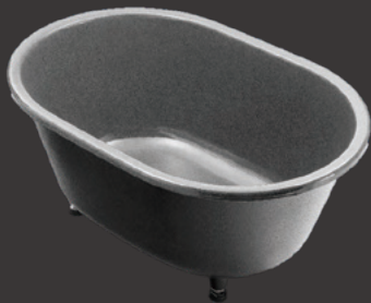
鑄物ホーロー浴槽 やまと